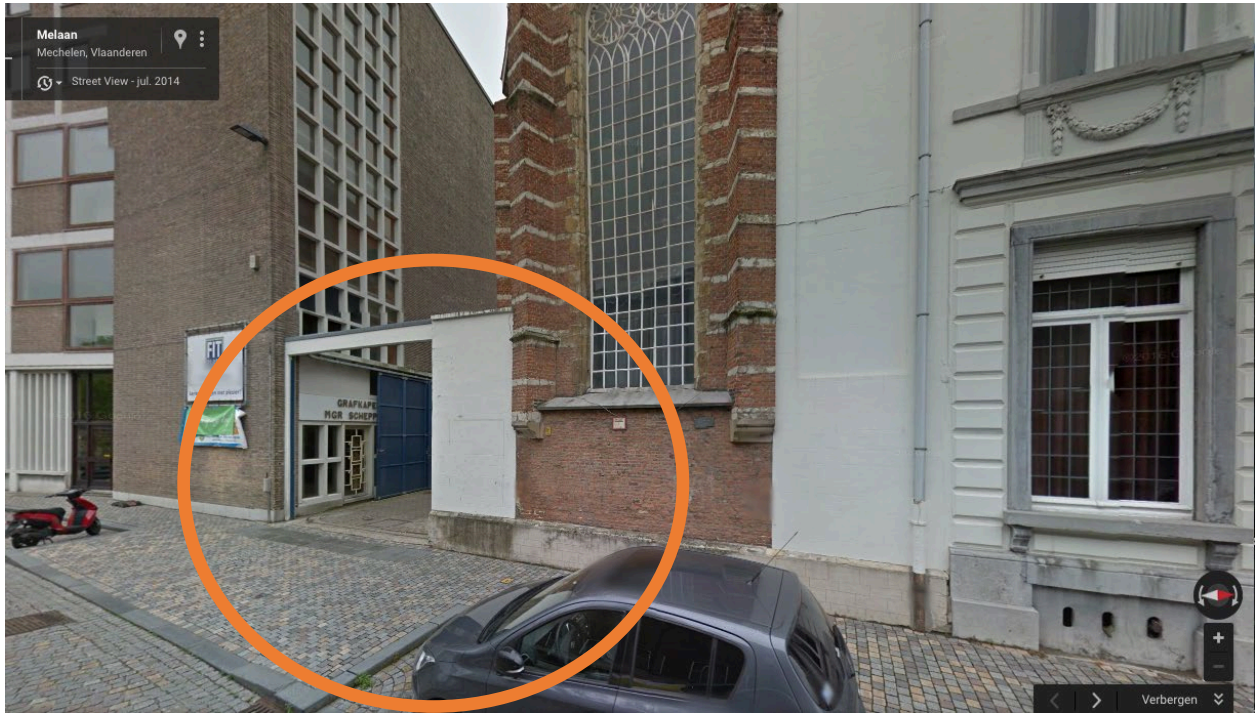
De toegangspoort van het Scheepersinstituut